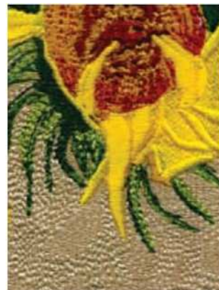
Рисунок, выполненный нитками Madeira CLASSIC №40 (искусственный шелк)

Разница во внешнем виде между вышивками, выполненными стандартными вышивальными нитками толщиной №40, такими как Madeira CLASSIC или POLYNEON и BURMILANA №12, показана на фотографиях справа.