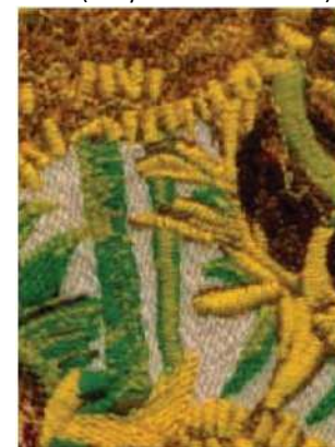
Рисунок, выполненный нитками BURMILANA №12 (шерстяная смесовая толстая вышивальная нить)